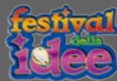
Illustrazione in copertina di Cristina Berardo

Comune di Nogara Assessorato alla Cultura